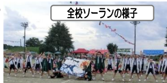
全校ローランの様子