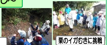
栗のイガむきに挑戦