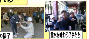
墨水を味わう子供たち