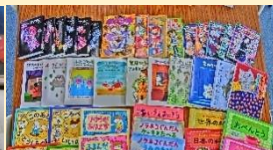
寄贈いただいた40冊の本